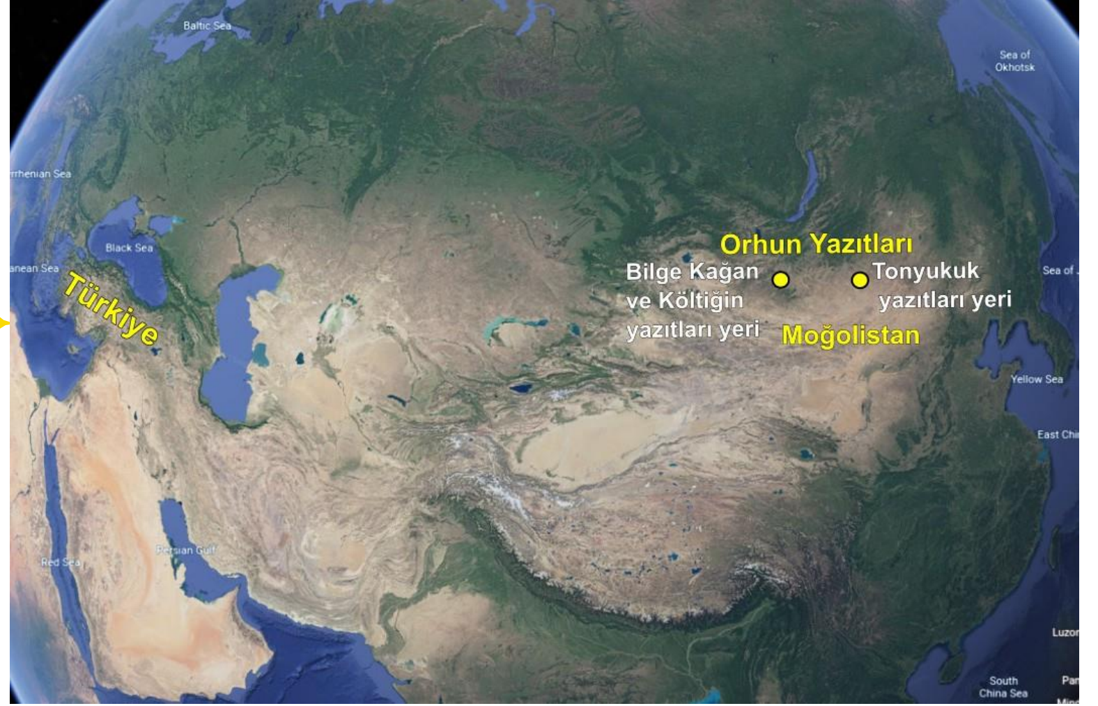
Bilge Kağan ~ Orhun Yazıtları

Türkler'in bilinen ilk alfabesi olan Göktürk Alfabesi ile eski Türkçe yazılı 4 adet dikili anıt taştan oluşur. Bu yazılı taşlar Moğolistan'dadır. Yazıtların ikisi, Bilge Kağan ve Költiğin Yazıtı, Karakurum şehri yakınlarındaki Orhun Irmağı kıyısındadır ve bu nedenle "Orhun Yazıtları" diye bilinirler. Diğer ikisi ise Ulan Batur şehri Nalaikh kasabası yakınlarında bulunan Bilge Tonyukuk Yazıtları'dır.